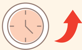
<틈새돌봄 또는 돌봄시간 연장>

* 정규수업 전 아침돌봄(07:00~09:00), 방과후 저녁돌봄(17:00~19:00) 등